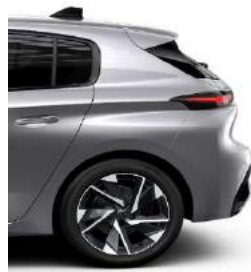
Allure Pack 17' Alloy Halong