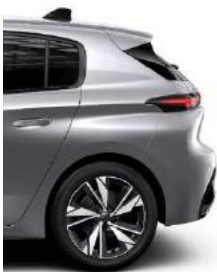
Allure 17' Alloy Calgary