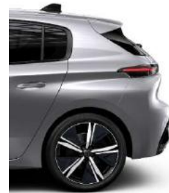
GT 18' Alloy Kamakura